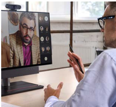
Biurko dyrektora, telezdrowie, zdalna nauka, budka telefoniczna