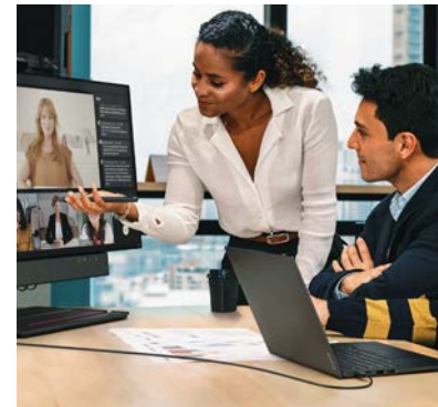
Małe pomieszczenia do konferencji wideo i konsultacji medycznych