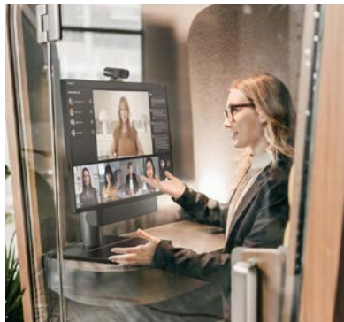
Wirtualna recepcja, hoteling i hot desking